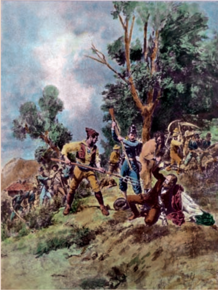
La morte di Carlo Pisacane e dei suoi compagni a Sapri, il 2 luglio 1857, in una stampa dell'epoca.