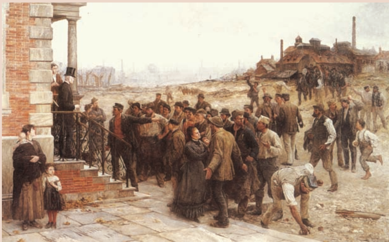
Robert Koehler, Lo sciopero , 1886 (Londra, collezione privata). Secondo Pisacane, lo sciopero poteva essere un mezzo utile alle classi lavoratrici per arrivare al socialismo rivoluzionario.

→ Quali pericoli politici comporta l'insistenza sul fatto che l'élite è l'unica a conoscere la strada che porta alla liberazione delle masse?