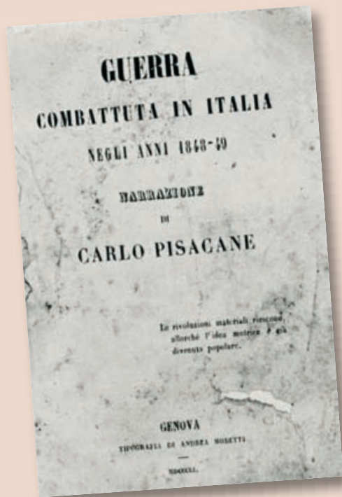
Frontespizio del libro Guerra combattuta in Italia negli anni 1848-49 , di Carlo Pisacane.