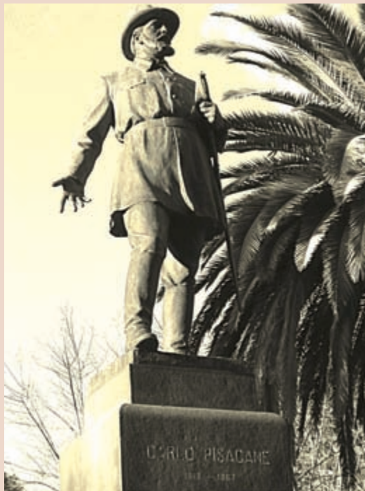
Statua in memoria di Carlo Pisacane a Sapri, in Campania.