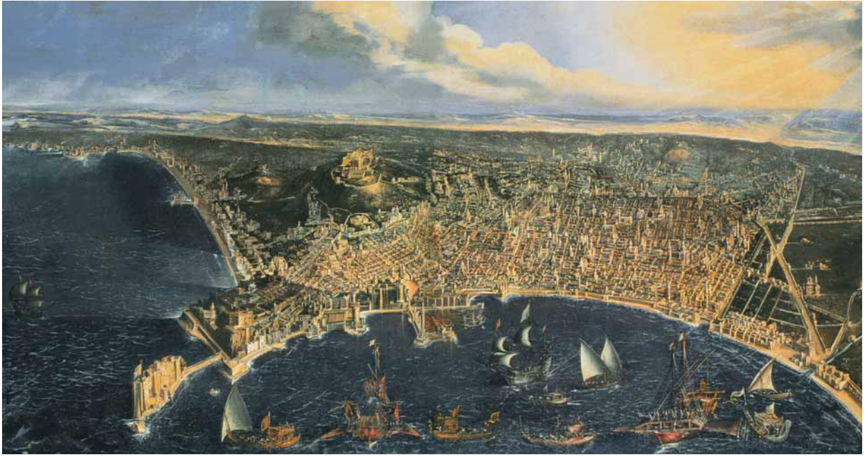
Didier Barra, Veduta a volo d'uccello di Napoli , 1647 (Napoli, Museo nazionale di San Martino).

nella società meridionale, nella quale – a metà del Seicento – la forza prevalente, quella che meglio avrebbe potuto sostenerne uno sforzo indipendentistico, era certamente la nobiltà. Questa però era pure una classe con esigenze solo in parte coincidenti con quelle del paese e, per il corso assunto dalla rivolta, si trovava naturalmente respinta verso la Spagna, malgrado ogni suo precedente conato [sforzo, tentativo, n.d.r. ] autonomistico, mentre le forze sicuramente antifeudali, che portarono avanti la rivolta, non avevano – come si è detto – la consistenza e la maturità necessarie per un autentico rinnovamento del paese.