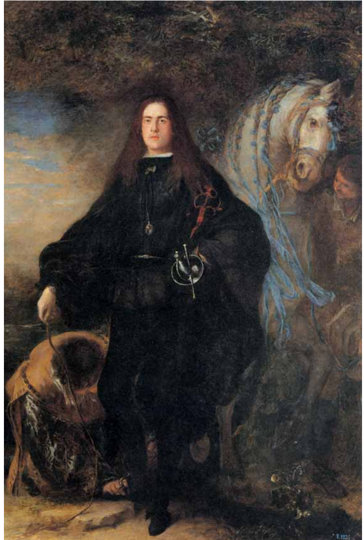
Un nobile spagnolo in un dipinto del XVII secolo.

Nel momento stesso in cui la gabella fu introdotta di nuovo, il mercato della frutta fu strettamente controllato da numerosi ufficiali , mentre furono erette diverse case all'interno delle quali avveniva il versamento del denaro. Secondo il cronista del tempo Giuseppe Pollio, gli « ufficiali di detta gabella » divennero presto il bersaglio dell'odio generale, in quanto « come tante tigre, voleano far schiavo il sangue humano ». In effetti, per chi fosse stato scoperto a introdurre in città frutta di qualsiasi genere senza aver preventivamente pagato l'imposta, scattavano l'accusa di contrabbando e la pena del carcere, mentre la gente comune protestava per l'inevitabile aumento dei prezzi.