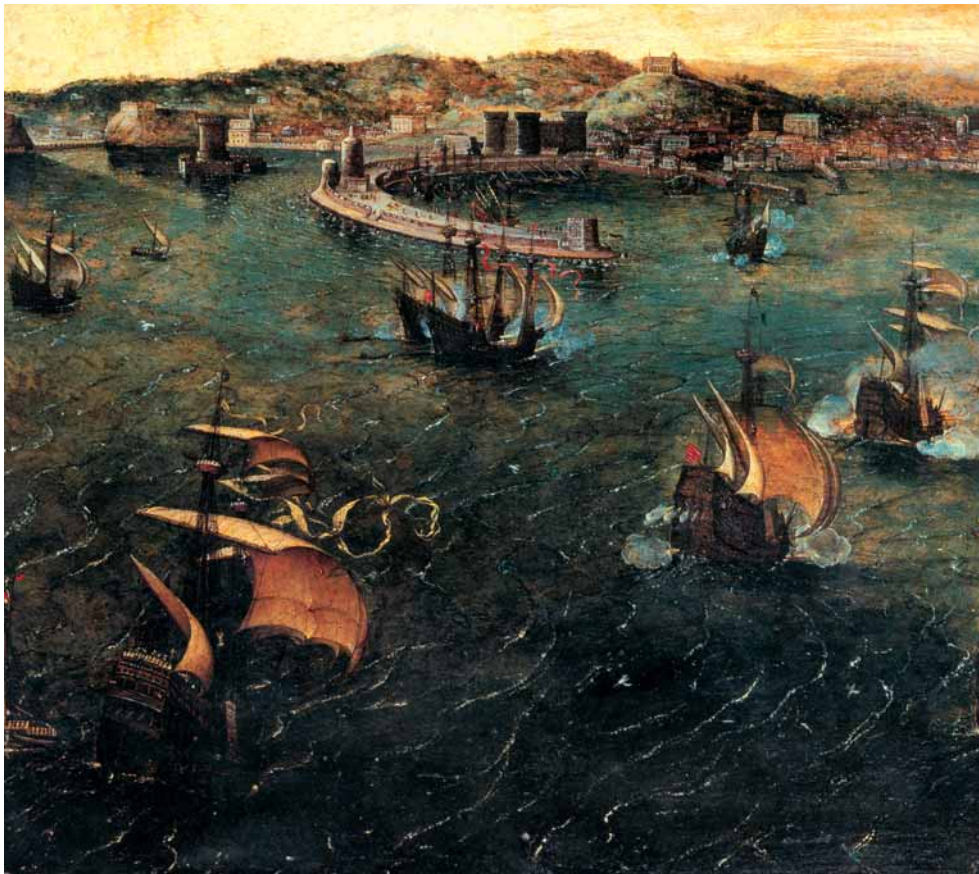
Una veduta del golfo di Napoli in un dipinto del XVI secolo (Roma, Galleria Doria Pamphilj).

Innanzitutto, va segnalato che il regno di Napoli non era una colonia, come invece lo erano i possedimenti americani. Nel Nuovo Mondo, i conquistatori avevano incontrato numerose realtà statali (l'impero degli atzechi, le città maya, lo Stato inca), ma a esse non avevano riconosciuto alcuna validità. Le immense regioni americane erano giudicate come una specie di terra di nessuno , priva di dominio legittimo, sicché il re di Castiglia si era inserito in quel presunto vuoto di potere e l'aveva riempito, appropriandosi del Messico e del Perù. In questi Paesi, gli indigeni erano stati privati di qualsiasi diritto: di fatto, trasformati in schiavi al servizio dei dominatori. A loro volta, gli spagnoli che si trasferivano oltre oceano erano soggetti a una serie di precise limitazioni, tipiche di ogni contesto coloniale: ad esempio, potevano commerciare solo con la madre patria e non potevano impiantare manifatture di alcun genere, affinché l'economia dei territori americani restasse rigidamente controllata dall'Europa e non facesse alcuna concorrenza alla Spagna.