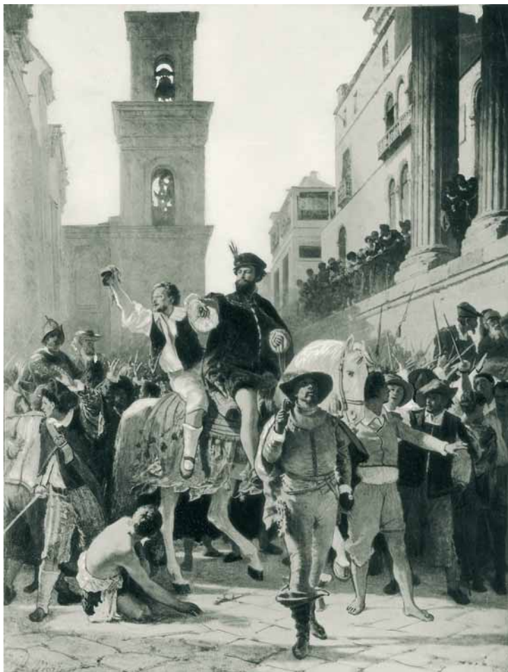
Masaniello in trionfo per le vie di Napoli in una ricostruzione ottocentesca.

Nei momenti più gravi di crisi, oppositori e popolazioni coinvolte nella protesta dovettero quindi misurarsi con il problema del rispetto dei limiti che, indipendentemente dalle loro intenzioni, la fedeltà imponeva o del suo abbandono. Il principio, però, non poteva essere puramente e semplicemente rinnegato senza mettere a rischio le basi della solidarietà collettiva e della comunità politica in quanto tale. Per affermare la loro legittimità i ribelli, là dove furono in grado di farlo, dovettero appropriarsene, reinterpretandolo alla luce della tradizione storica, della situazione politica, dei valori morali e religiosi, come avvenne appunto a Napoli. [...] I conflitti suscitati dall'insurrezione popolare sfociarono rapidamente nel mutamento o nell'abbandono di idee politiche fino allora radicate nella coscienza collettiva. Il principio di fedeltà acquistò un significato diverso e, per un aspetto fondamentale, antitetico rispetto alla versione ufficiale che metteva l'accento esclusivamente o prevalentemente sull'obbedienza al sovrano. Come conseguenza della vicenda storica che il Regno di Napoli stava attraversando e di un consapevole disegno politico dei ribelli, venne meno, non solo per ristretti gruppi dirigenti ma anche per una parte della popolazione, il suo secolare riferimento alla