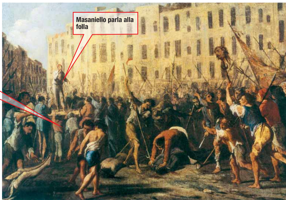
Micco Spadaro, La rivolta di Masaniello a Napoli , dipinto del XVII secolo.